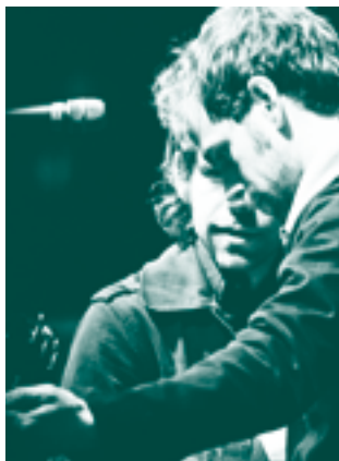
Aaron og Bryce Dessner

På programmet er også en anden "guitar-hero" fra den alternative rockscene: Jonny Greenwood fra det engelske band Radiohead. Værket er bestilt af BBC's Radio 3, og han brugte det også i soundtracket til den Oscarvindende film There Will Be Blood .